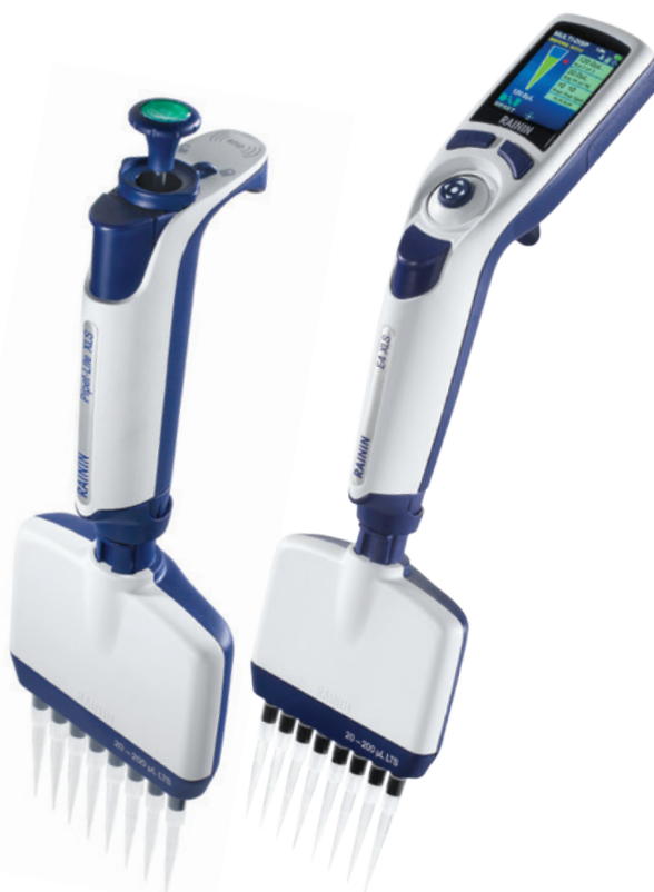
Modelos Pipet-Lite XLS+ y E4 XLS+

Agilice el trabajo con placas gracias a las pipetas multicanal electrónicas E4 XLS+ de Rainin. Los modos especiales optimizan la forma en la que se transfieren varias alícuotas, se realizan diluciones en serie y se preprograman series de transferencias de volumen.